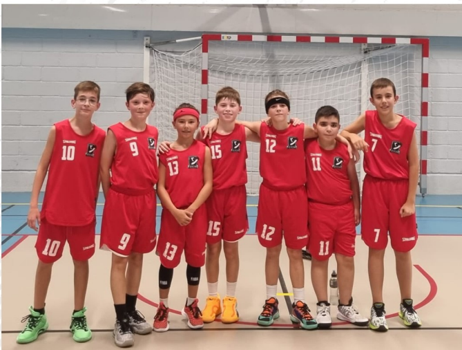
U13 Garçons 1

Nos équipes de U13 à U18 qui portent fièrement les couleurs de notre club, notamment en sélection de Moselle et de Lorraine depuis de nombreuses années.