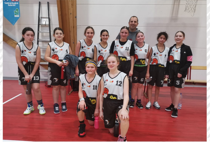
U13 Filles 2