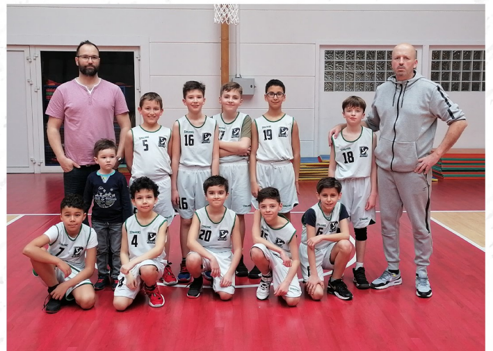
U11 Poussins Garçons 2