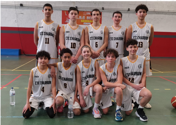
CTC U15 Garçons