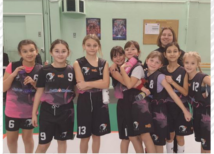
U11 Poussines Filles 2