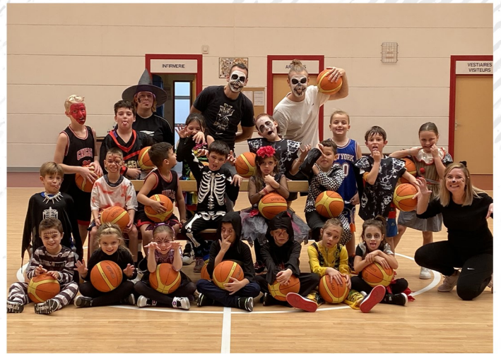
U9 Mini-poussins Mixte