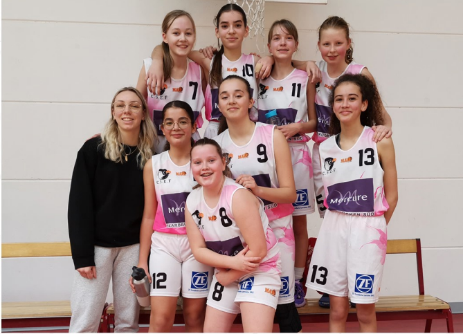
U13 Filles 1