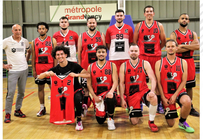
Seniors Masculins A Prénationale