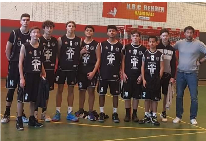
CTC U17 Garçons

CERCLE SAINT ELOI FOLKLING BASKETBALL RUE DU 6 DÉCEMBRE 1944 57600 FOLKLING