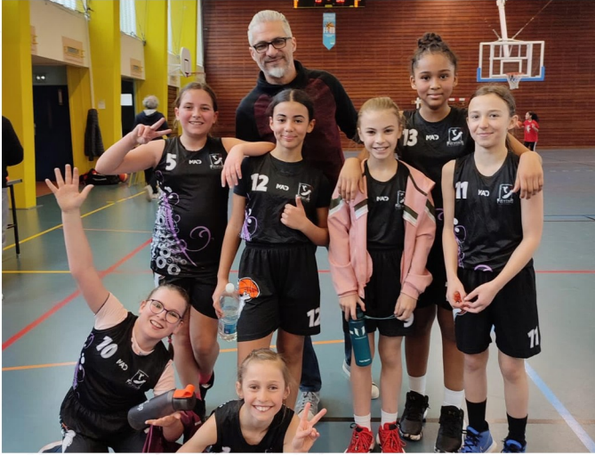
U11 Poussins Filles 1