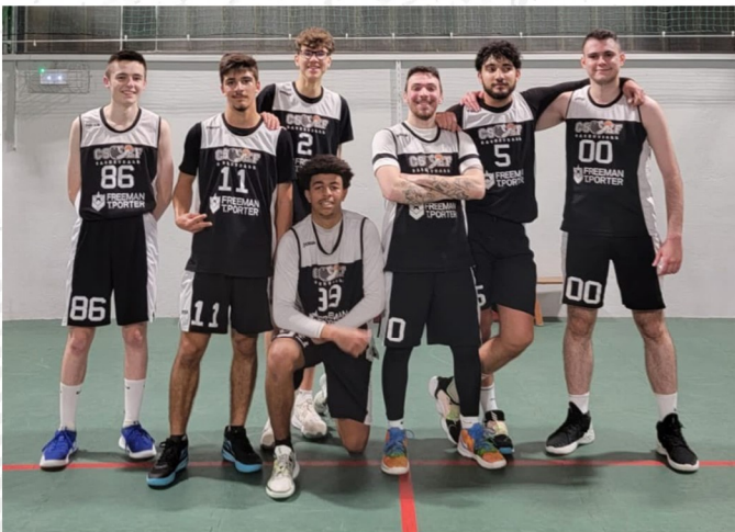
Seniors Masculins B