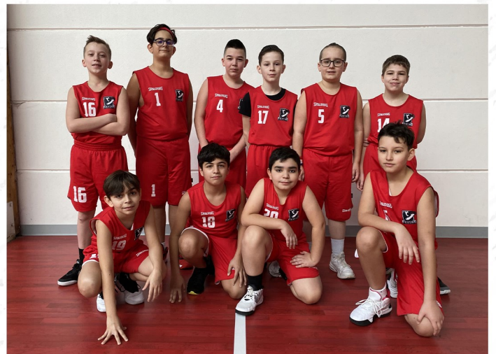
U13 Garçons 2