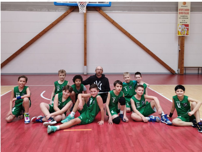
U11 Poussins Garçons 1